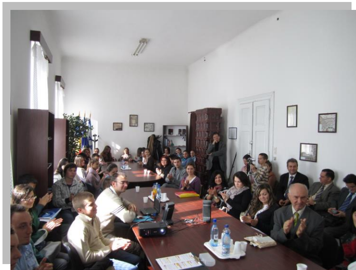
Activitate cu studenții la sediul centrului.

Într-o epocă în care integrarea europeană a devenit realitate, un astfel de centru nu poate face altceva decât să devină un liant al înțelegerii și cunoașterii reciproce.